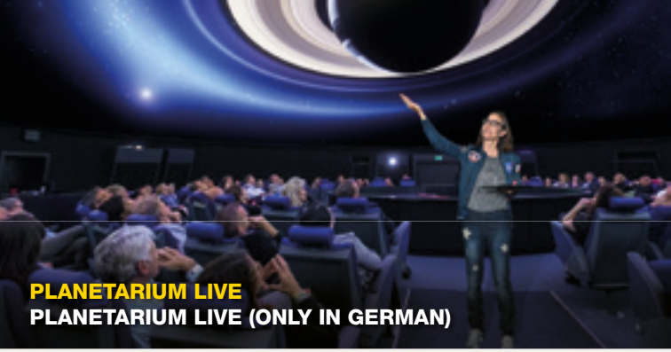
PLANETARIUM LIVE PLANETARIUM LIVE (ONLY IN GERMAN)

Kommen Sie mit, wenn das Planetarium seine Besucher mit auf eine Reise nimmt, die neben dem heutigen Sternenhimmel auch einmalige und erlebnisreiche Ausflüge in die Weiten des Weltraums zu aktuellen Themen beinhaltet. Und alles wird LIVE kommentiert vom Vorführpersonal des Planetariums!