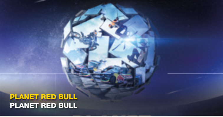
PLANET RED BULL PLANET RED BULL

Travel with the planetarium as it takes its visitors on journeys that include, alongside the current night sky, unique and stimulating explorations of the expanses of space and up-to-the-minute topics. Everything is commented LIVE by the planetarium's presenters!