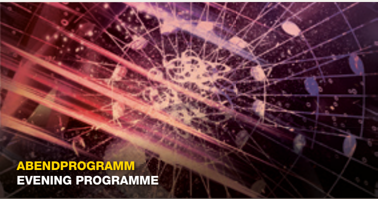
ABENDPROGRAMM EVENING PROGRAMME

Come along as the Planetarium explains the starry sky of the current season to its guests. With live commentary, the operators at the Planetarium show the planets currently visible, special events and hidden gems in the firmament. Trips into space provide a new perspective on known and unknown celestial bodies and ideally complement our earth-bound view.