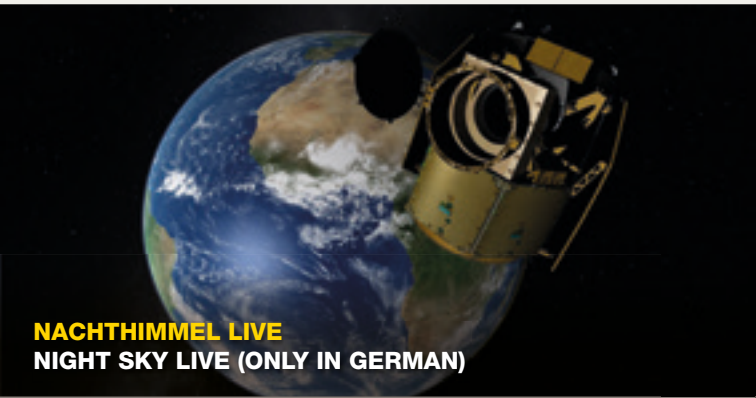
NACHTHIMMEL LIVE NIGHT SKY LIVE (ONLY IN GERMAN)

Kommen Sie mit, wenn das Planetarium seinen Gästen den Sternenhimmel der aktuellen Jahreszeit erklärt. Live kommentiert (nur in Deutsch) zeigt das Vorführpersonal des Verkehrshaus Planetariums die momentan sichtbaren Planeten, spezielle Ereignisse und versteckte Perlen am Firmament.