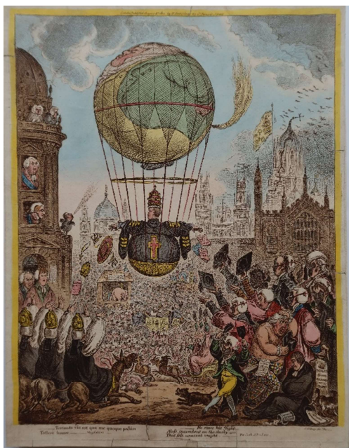
Englische Karikatur, 1810, VA-65133