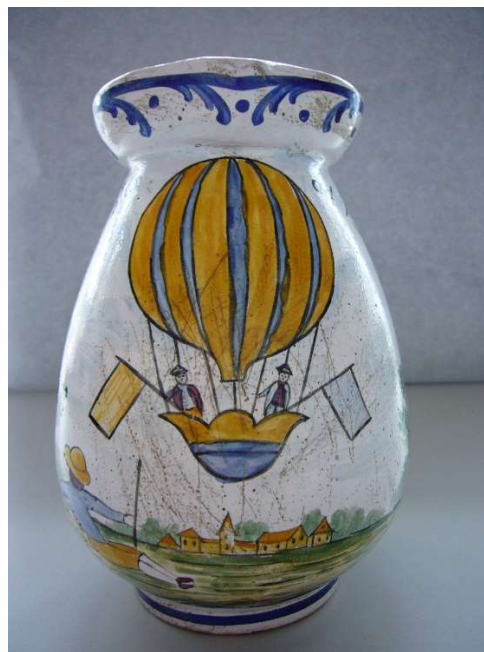
Keramikkrug, VHS-5915 Fotos Verkehrshaus der Schweiz, Luzern