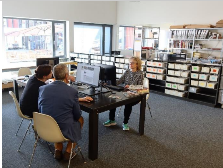
Crashkurs für die Online-Recherche im Dokumentationszentrum.