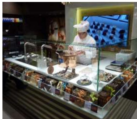
Maître Chocolatier live im Verkehrshaus