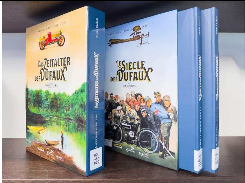
Die beiden Sprachausgaben «Das Zeitalter der Dufaix» und «Le Siècle des Dufaix»